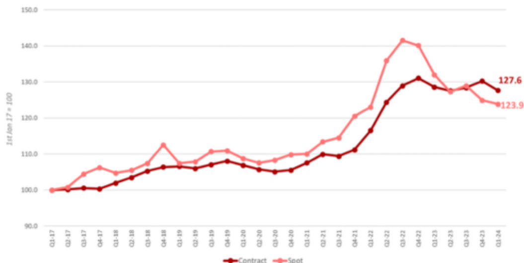
European road freight rate indexes in Q1 2024

Αναλυτικότερα, σύμφωνα με τα ευρήματα της έρευνας, προκύπτουν ότι κατά το α' τρίμηνο του 2024: