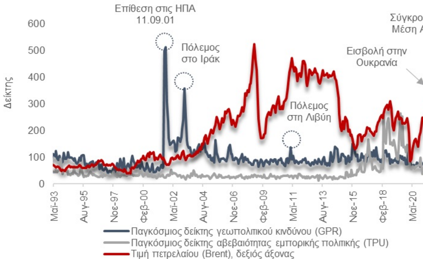
Γράφημα 1. Γεωπολιτικός κίνδυνος και τιμές πετρελαίου

Όπως φαίνεται στο συγκεκριμένο γράφημα, τις τελευταίες τρεις δεκαετίες οι γεωπολιτικές αναταραχές δεν συνδέονται συστηματικά και για μεγάλο χρονικό διάστημα με υψηλότερες ή πιο ασταθείς τιμές του πετρελαίου.