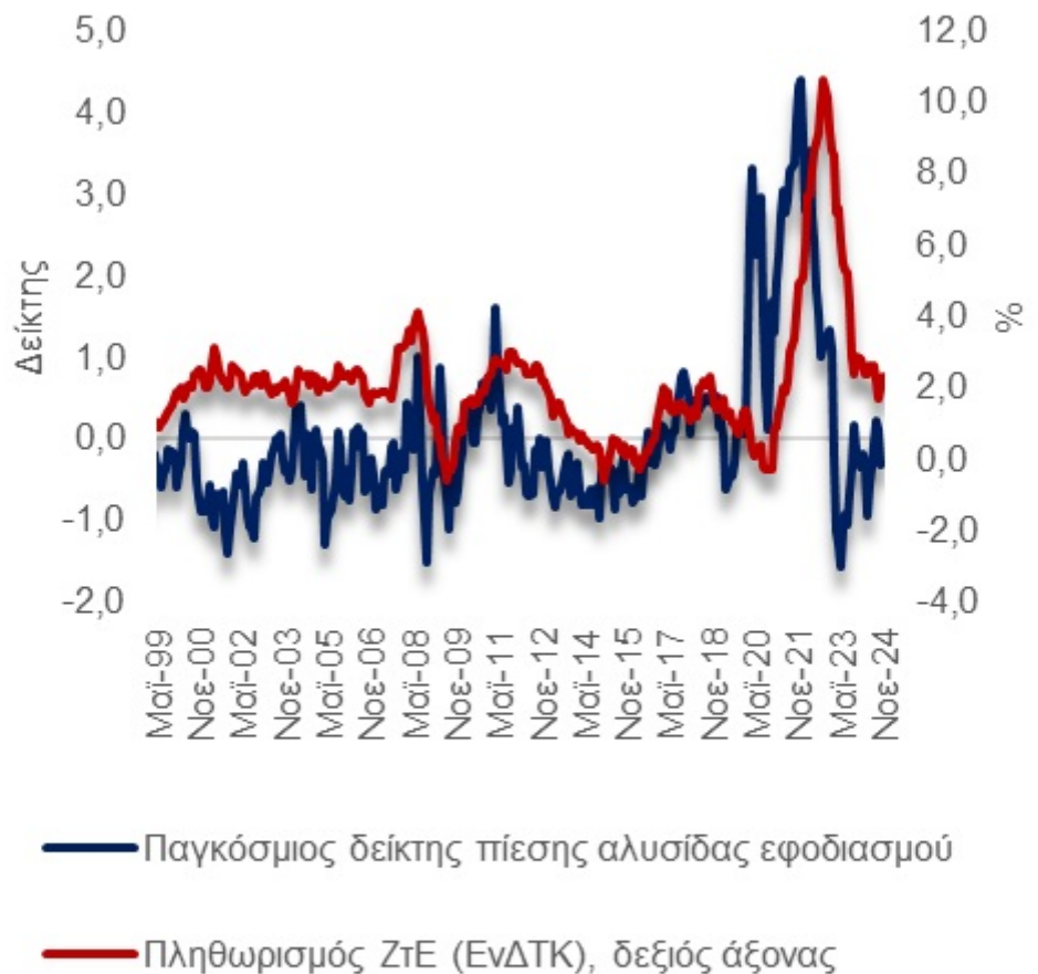
Γράφημα 2β. Παγκόσμιος δείκτης εφοδιαστικής αλυσίδας

Η επιλογή εναλλακτικών διαδρομών έχει ως αποτέλεσμα τη σημαντική αύξηση του κόστους μεταφοράς, καθώς και καθυστερήσεις στην εφοδιαστική αλυσίδα.