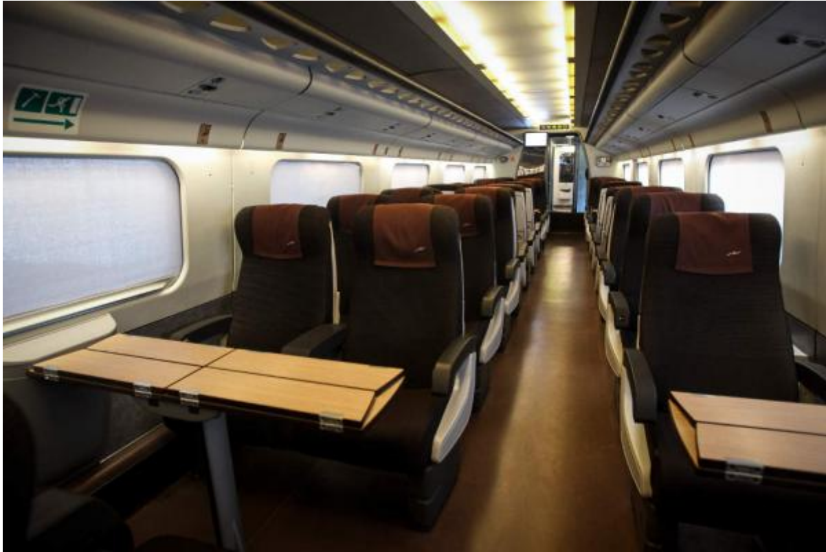
Το εσωτερικό του τρένου

Ο υφυπουργός Υποδομών και Μεταφορών κ. Νίκος Μαυραγάνης ανέφερε στη δήλωσή του ότι «ταξιδεύουμε αυτή τη στιγμή με πάνω από 200 km.