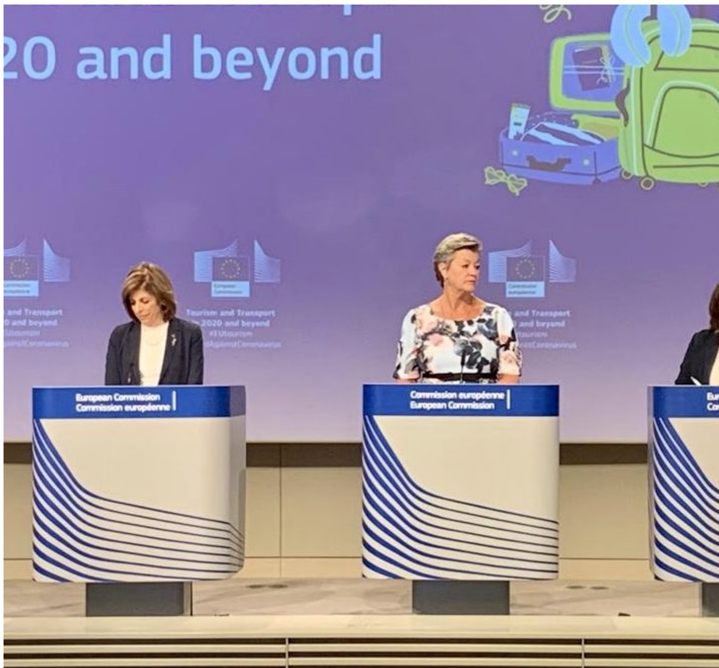
Στιγμιότυπο από την σημερινή συνέντευξη Τύπου

Ωστόσο, οι επιβάτες θα πρέπει να είναι υποχρεωμένοι να φορούν μάσκες κατά την διάρκεια της πτήσης, αλλά και στους χώρους των αεροδρομίων.