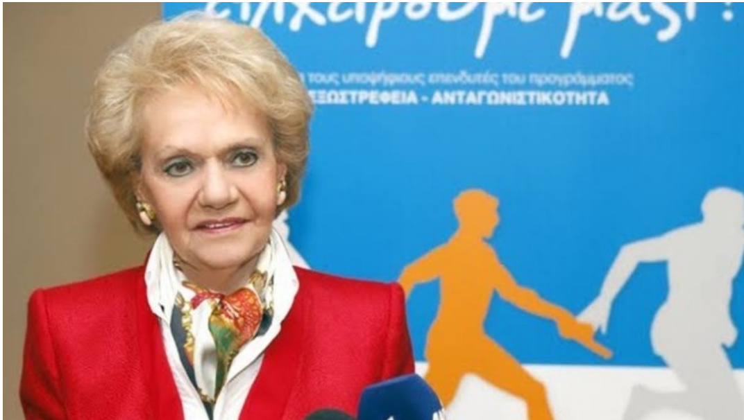
Η πρόεδρος του ΠΣΕ

-Το παραγωγικό μοντέλο ασφαλώς πρέπει και μπορεί να αλλάξει. Είναι επιτακτική ανάγκη να ενισχύσουμε την εγχώρια παραγωγή και να τονώσουμε την εξωστρέφειά μας. Πέραν των παραδοσιακών προϊόντων, χρειάζεται μια στροφή προς νέα καινοτόμα προϊόντα, τα οποία θα ενσωματώνουν τις τεχνολογικές εξελίξεις, αλλά και προϊόντα που θα απαντούν στις καινούριες ανάγκες των ξένων καταναλωτών.