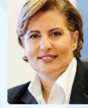
Χριστιάνα Καλογήρου Γενική Γραμματέας Αγροτικής Ανάπτυξης και Τροφίμων Υπουργείο Αγροτικής Αναπτυξης