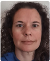
Ντία Χωραφά Οργάνωση Μπορούμε/ Συντονιστής Συμμαχίας για τη Μείωση της Σπατάλης Τροφίμων*