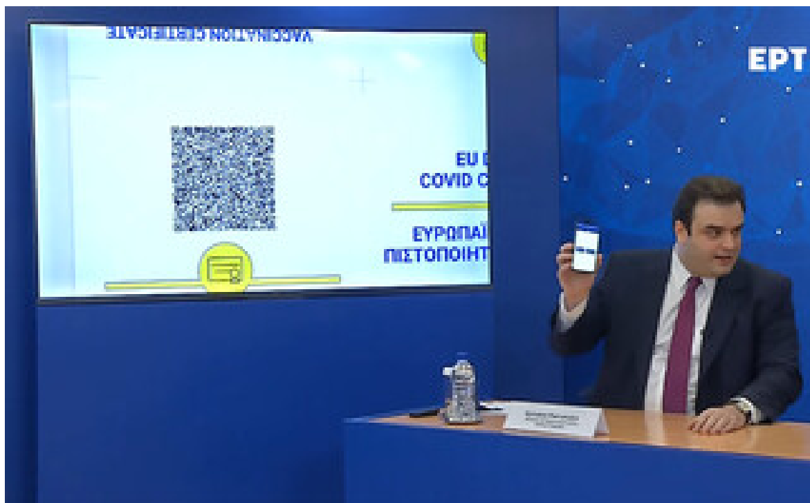
Ο κ. Πιερρακάκης παρουσιάζει το Ευρωπαϊκό Ψηφιακό Πιστοποιητικό COVID.

«Είναι σαφές πως το πιστοποιητικό γίνεται πραγματικότητα και μάλιστα διανύσαμε μακρύ δρόμο, καθώς στην έναρξη της διαδικασίας, τον Ιανουάριο, λίγοι πίστευαν σε αυτή την ιδέα και επικρατούσε έντονος σκεπτικισμός για το κατά πόσο η Ευρώπη μπορεί να πετύχει κάτι τέτοιο. Είμαι πολύ χαρούμενος που καταφέραμε να φτάσουμε σε αυτή τη μεγάλη, ευρωπαϊκή συμφωνία» τόνισε.