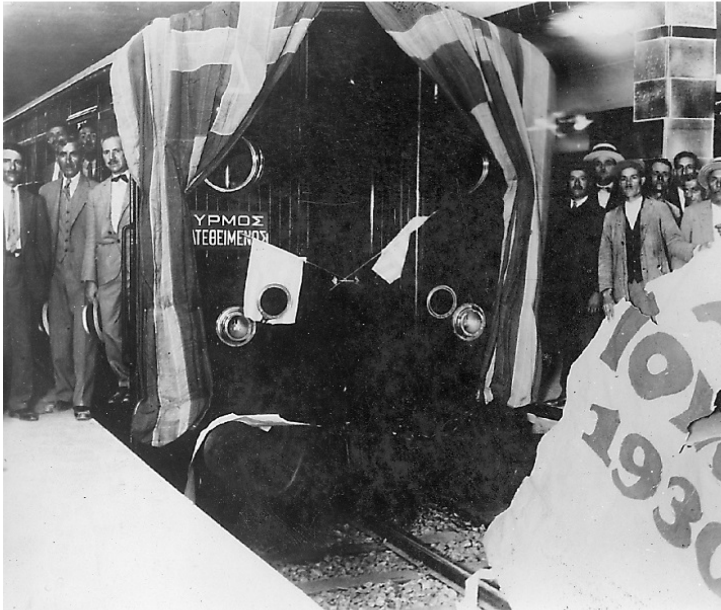
Εγκαίνια σταθμού Ομοιοίας 1930