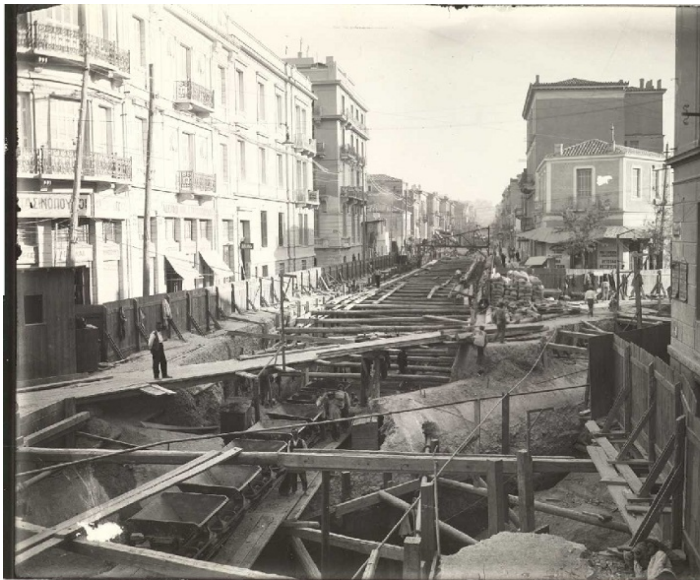
1928 Διάνοιξη σήραγγας Αττική - Ομόνοια