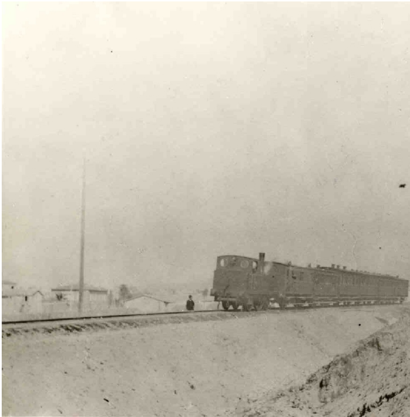
Ατμήλατος συρμός Ν. Φάληρο 1883