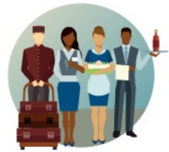
Cruise-Supported Jobs (millions)