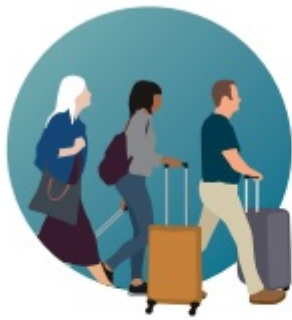
Passenger Embarkations (millions)