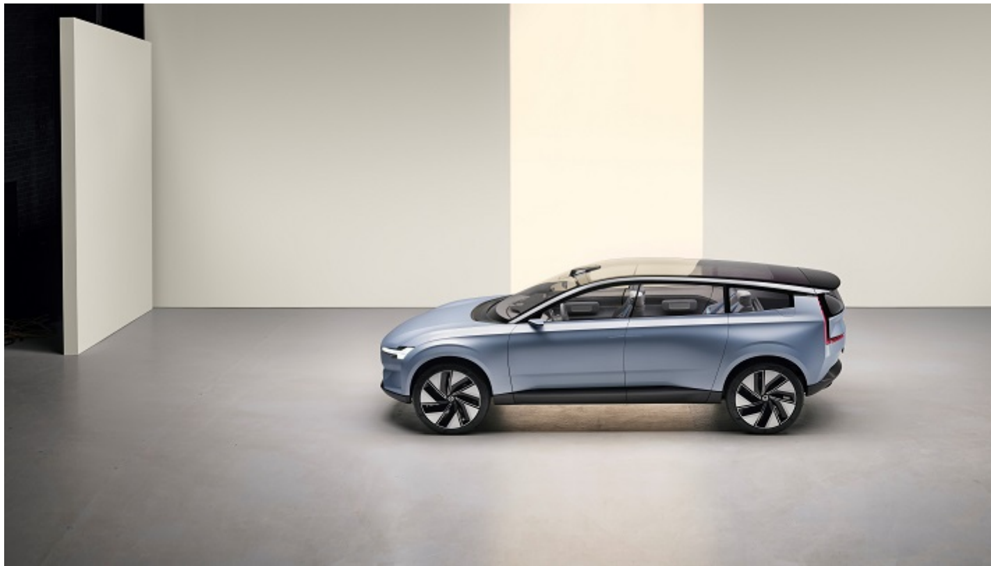
Volvo Concept Recharge Exterior