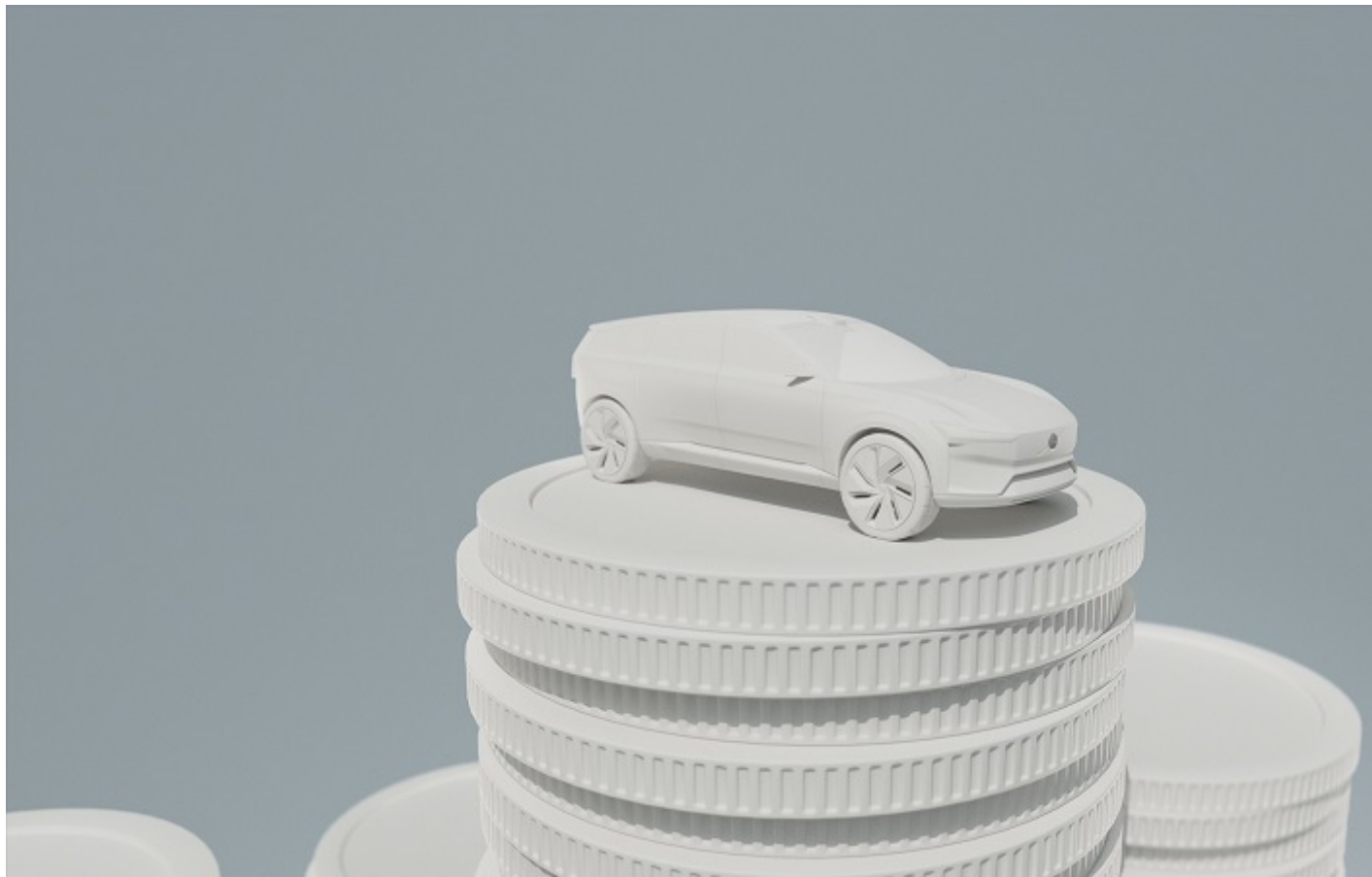
Volvo Cars Torslanda investments

«Με αυτές τις επενδύσεις κάνουμε ένα σημαντικό βήμα προς το αποκλειστικά ηλεκτρικό μας μέλλον και προετοιμαζόμαστε για ακόμη πιο προηγμένα και καλύτερα ηλεκτρικά Volvo», δήλωσε ο Håkan Samuelsson, διευθύνων σύμβουλος της εταιρείας, συμπληρώνοντας ότι «η Torslanda είναι το μεγαλύτερο εργοστάσιό μας και θα διαδραματίσει κρίσιμο ρόλο στη συνεχιζόμενη μεταμόρφωσή μας , καθώς προχωράμε για να γίνουμε ένας κατασκευαστής αμιγώς ηλεκτρικών αυτοκινήτων μέχρι το 2030».