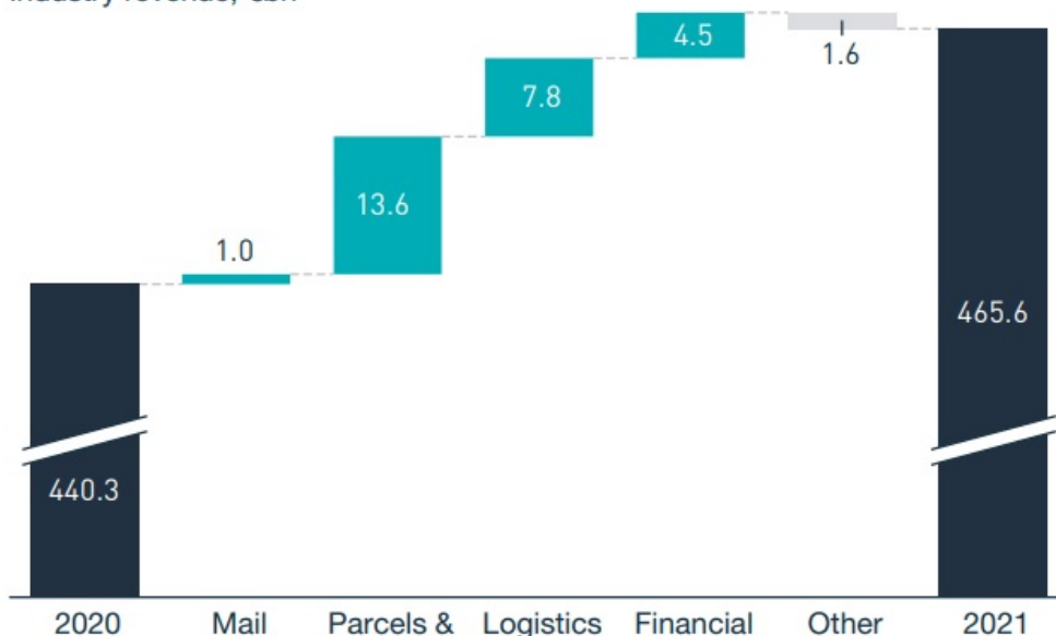
Industry revenue, €bn

Ωστόσο, με τον όγκο να συνεχίζει να μειώνεται για τους περισσότερους, τα έσοδα από το κομμάτι της αλληλογραφίας συνέχισαν να μειώνονται κατά μέσο όρο.