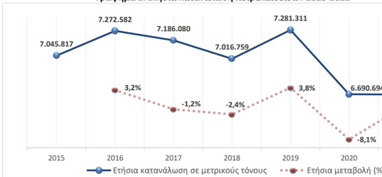
Γράφημα 1: Ετήσια κατανάλωση πετρελαιοειδών 2015-2021

Συγκεκριμένα, παρατηρείται αύξηση στην ετήσια κατανάλωση της αμόλυβδης βενζίνης κατά 5,1%, της βενζίνης σούπερ αμόλυβδης 98/100 κατά 13,6%, του πετρελαίου κίνησης κατά 4,1% και του υγραερίου κατά 6,6%.