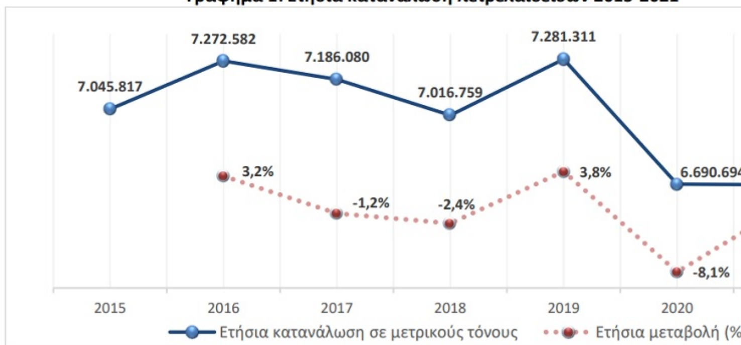
Γράφημα 1: Ετήσια κατανάλωση πετρελαιοειδών 2015-2021

Συγκεκριμένα, παρατηρείται αύξηση στην ετήσια κατανάλωση της αμόλυβδης βενζίνης κατά 5,1%, της βενζίνης σούπερ αμόλυβδης 98/100 κατά 13,6%, του πετρελαίου κίνησης κατά 4,1% και του υγραερίου κατά 6,6%.